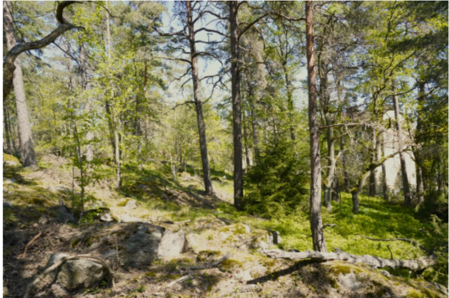
Figur 2. Majroskogen domineras av flerskiktad skog med lång trädkontinuitet.

I området finns fyra registrerade nyckelbiotoper – dessa områden utgör reservatets värdekärnor tillsammans med det mycket gamla tallskogsparti och en äldre hållmarkstallskog som ligger i reservatets norra del.